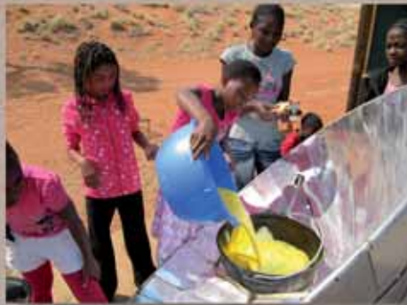
Au Centre NaDEET on apprend à utiliser une cuisinière solaire (en haut) et à surveiller sa consommation d'eau (en bas).