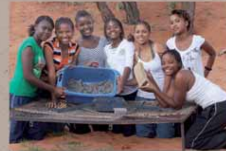
Des élèves fabriquent des briques à brûler